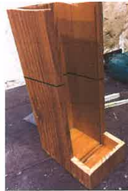
3. scier la partie haute pour le toit

4. coller ou visser la partie avant en mettant une calle pour bloquer le plexi