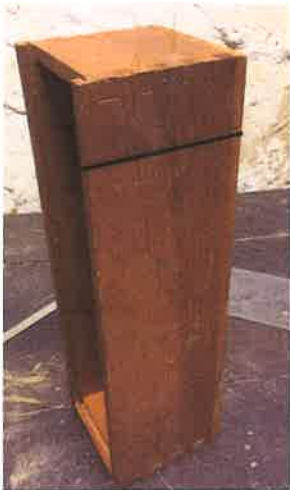
1. scier la boîte à 4 cm